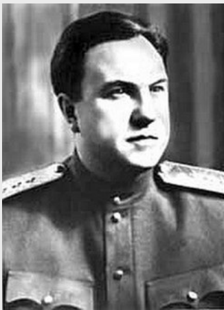
Wiktor Siemionowicz Abakumow, generał-pułkownik sowieckiego aparatu bezpieczeństwa, jeden z największych zbrodniarzy stalinowskich, w aparacie terroru zaskrynął m.in. z własnoręcznego torturowania i wymuszania zeznań na skazanych.