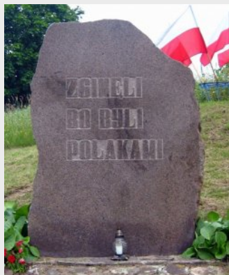
Tablica na wzgórzu w Gibach poświęcona pomordowanym przez Sowieców w obławie augustowskiej w lipcu 1945 r.

Śledczy z Instytutu Pamięci Narodowej będą się domagać od Rosjan przekazania innych dokumentów. Już w ubiegłym roku dwukrotnie zwracali się do nich o pomoc prawną. Do tej pory nie uzyskali odpowiedzi.