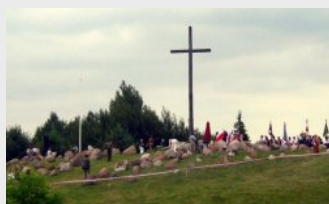
Krzyż w Gibach poświęcony pamięci pomordowanych w obławie augustowskiej w lipcu 1945 r.