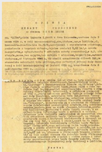
Opinia składu sądownego Reginę Ozgę „Lilke” (strona 1), świadcząca o jej wyjątkowo godnej postawie w obliczu zasądzonej kary śmierci w dn. 14 VIII 1952 r.