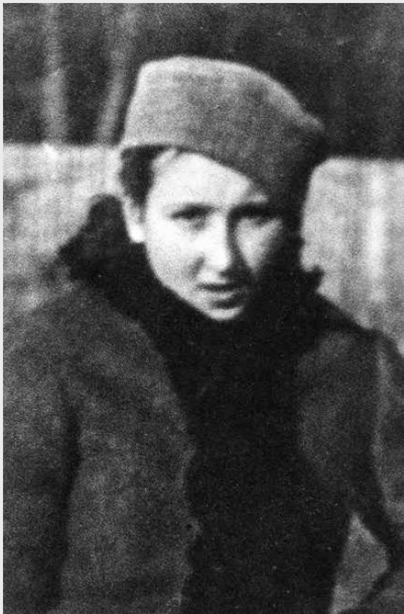
Danuta Siedzikówna (1928-1946)