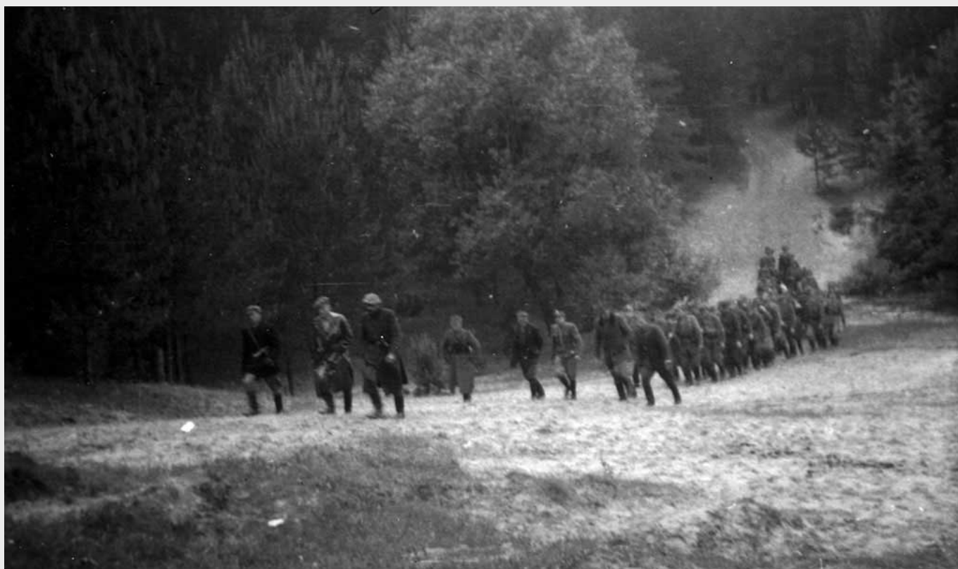
Kurs młodszych dowódców piechoty Obwodu Tomaszów Lubelski AK-DSZ, kwiecień-maj 1945 r.