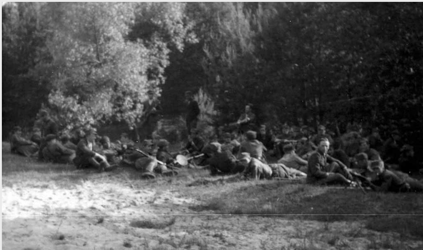
Kurs młodszych dowódców piechoty Obwodu Tomaszów Lubelski AK-DSZ, kwiecień-maj 1945 r.