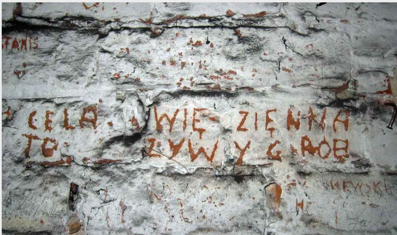
Napisy pozostawione przez więźniów Powiatowego Urzędu Bezpieczeństwa Publicznego w Radzynie Podlaskim. Dzisiaj cele dawnego aresztu Gestapo i UB służą mieszkańcom niszczonego budynku jako zwykłe piwnice