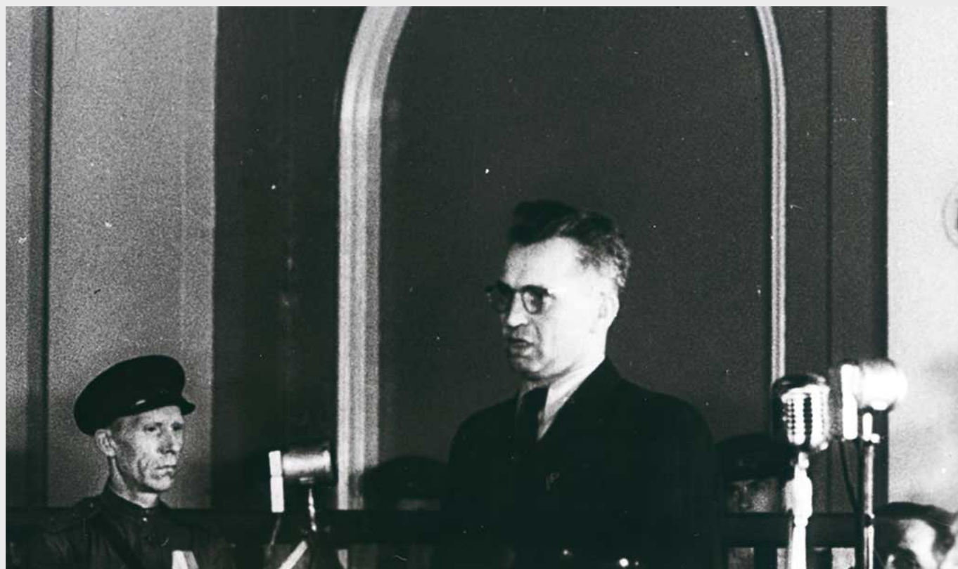
Gen. Leopold Okulicki - Komendant Główny AK w czasie procesu „szesnastu” w Moskwie

Nadano mu olbrzymi rozgłos w ZSRR. Nie bez znaczenia był też fakt, iż w tym samym czasie w Moskwie trwały rozmowy na temat powołania Tymczasowego Rządu Jedności Narodowej. Stawiało to w dwuznaczej sytuacji S. Mikołajczyka, który brał w nich udział. Reakcje zachodnich rządów, które oprócz niewiele znaczących gestów tuż po aresztowaniu „szesnastu” nie uczyniły faktycznie nic, oraz wyraźne odprężenie wśród nich po zakończeniu procesu były sygnałem, że nie zamierzają one autentycznie angażować się w sytuację wewnętrzną w Polsce.