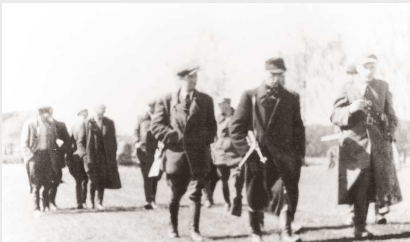
Odprawa kadry dowódczej Inspektoratu Zamość AK-DSZ, Huta Różaniecka, pow. Lubaczów, maj 1945 r.