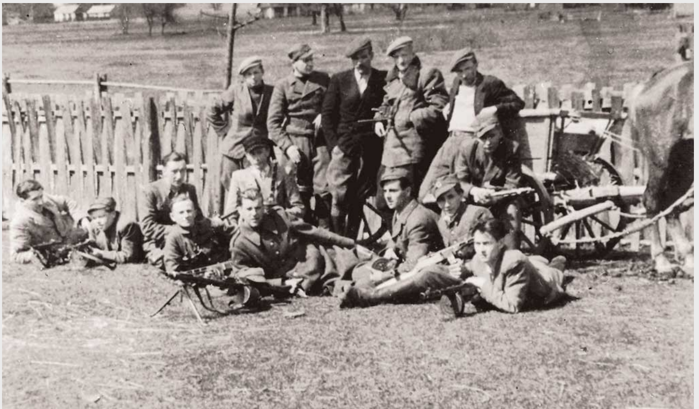
Żołnierze oddziału dyspozycyjnego kompanii „Narol” V Rejonu Obwodu Tomaszów Lubelski AK- DSZ, Huta Różaniecka, pow. Lubaczów, maj 1945 r.