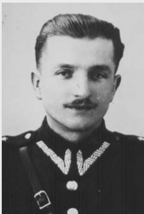
Kpt. Kazimierz Kamiński „Huzar”

https://podziemiezbrojne.ipn.gov.pl/zol/biogramy/90948,Kpt-Kazimierz-Kamienski-Huzar.html 2022-06-27, 01:57